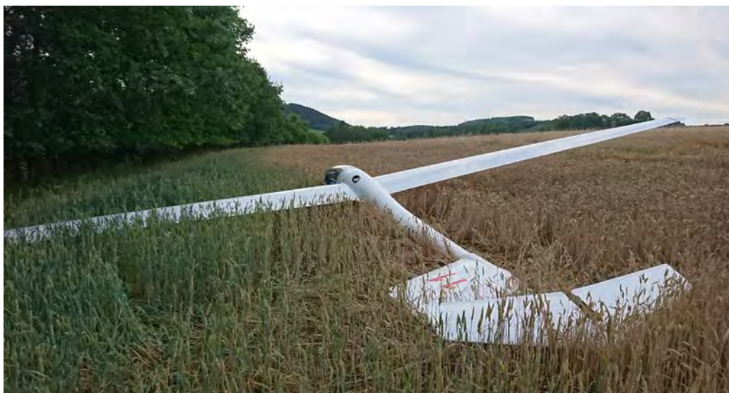
Obr. č. 3: Pohled na kluzák na místě letecké nehody.